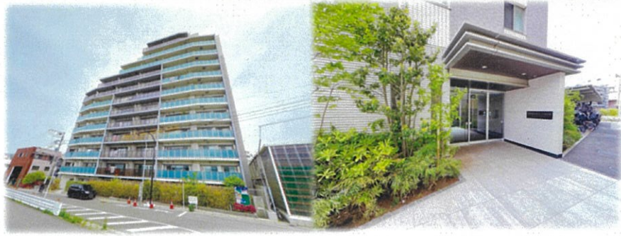
Point 外観 エントランス